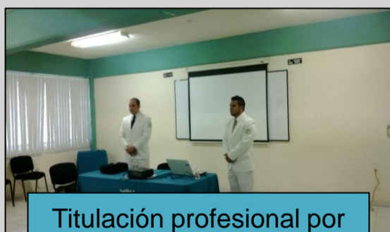
Titulación profesional por tesis julio 2014