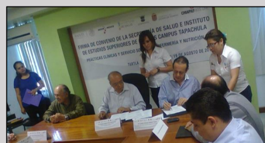
Firma de convenio en Tuxtla Gutiérrez, Chiapas